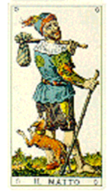
Tarotul italian vechi