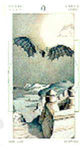
Tarotul Leonardo da Vinci