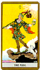
Tarotul Golden Rider