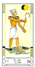
Tarot Egiptean (Fournier)