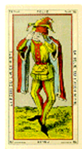
Tarotul cărții lui Thot