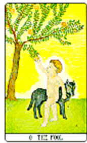
Tarotul Zorilor Aurii