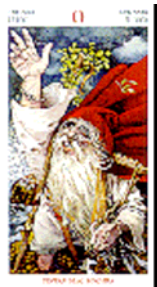
Tarotul celtic (Scarabeo)