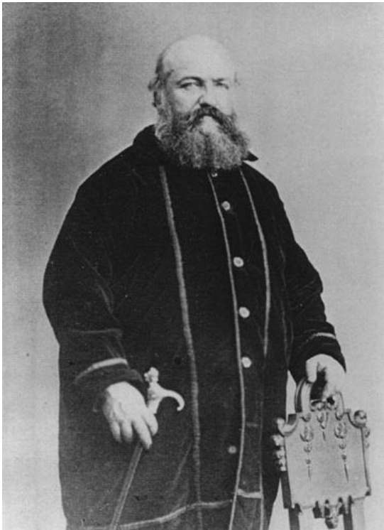
Eliphas Lévi , pe numele său real

Alphonse Louis Constant(8.12.1810-31.05.1875), a fost un autor francez de literatură ocultă. De origine modestă – fiind fiul unui cizmar din Paris – a urmat inițial studii religioase, respectiv seminarul romano-catolic. La 44 de ani, va călători însă în Anglia, unde va cunoaște pe președintele Ordinului Rozacruceanist, o mișcare de reformă politică și regenerare spirituală. Această mișcare își avea originile în Germania secolului XVII, având puternice elemente de alchimie, misticism și ocultism. Lévi va concepe, împreună cu alt membru al acestui ordin, o serie de lucrări care vor trata, pentru prima dată, magia. Acestea sunt: „Magia transcendentală – doctrină și ritual”, „Cheia Marilor Mistere”, „Fabule și simboluri”, „Știința spiritelor” și „Marele secret sau ocultismul dezvoltat”